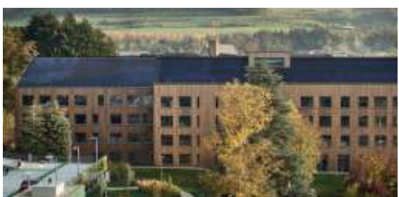
LTPS - Ettelbruck