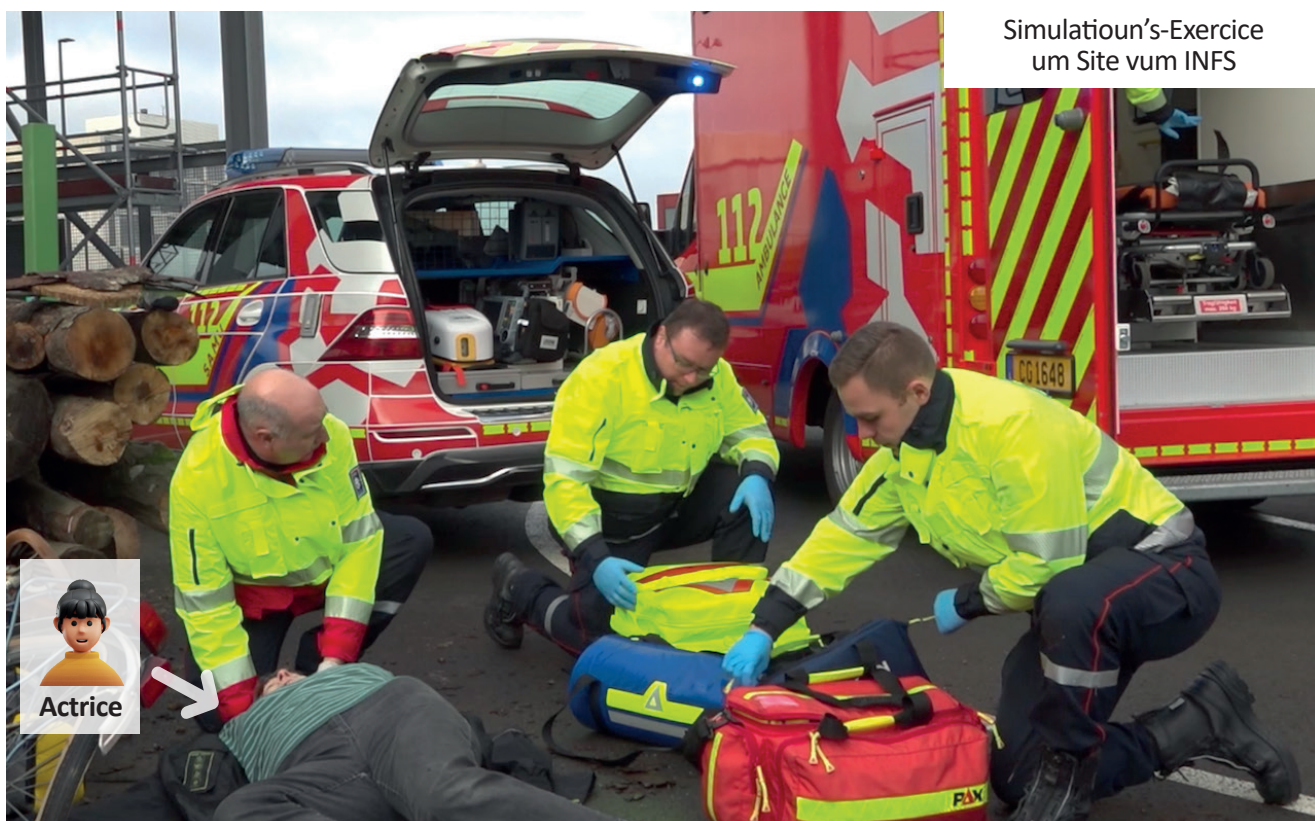
Simulatioun's-Exercice um Site vum INFS