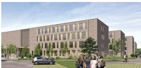
LTPS - Lycée Technique pour Professions de Santé Strassen

No der Formatioun hun d'Participantë dann d'Méiglechkeet, fir esouwuel bei de Simulatioun's-Exercicer am LTPS (op sengen 3 Standuerter zu Stroossen, Bascharage an Ettelbréck), wéi och am INFS (am Centre National d'Incendie et de Secours - CGDIS - zu Gaasperech) aktiv matzemachen.