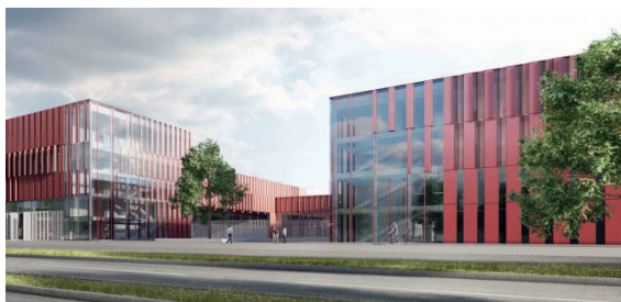
INFS - Institut National de Formation des Secours 3, boulevard de Kockelscheuer L-1821 Luxembourg

Interesséiert Leit kennen sech bis Mëtt September 2023 bei enger vun deenen 2 Persounen hei drenner melden: