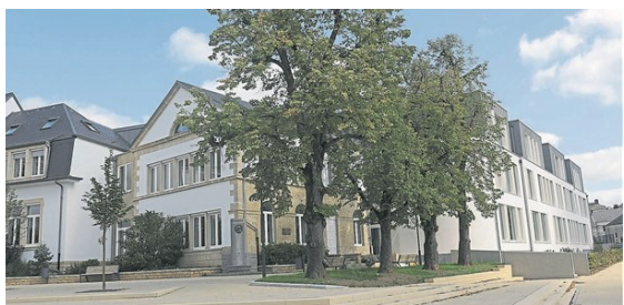
LTPS - Bascharage