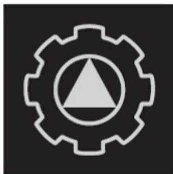
Insigne vum Pompier de support

De Pompier de support huet Urecht op eng Insigne, deen hien am Kader vu sengen Aufgaben als solchen ausweist.